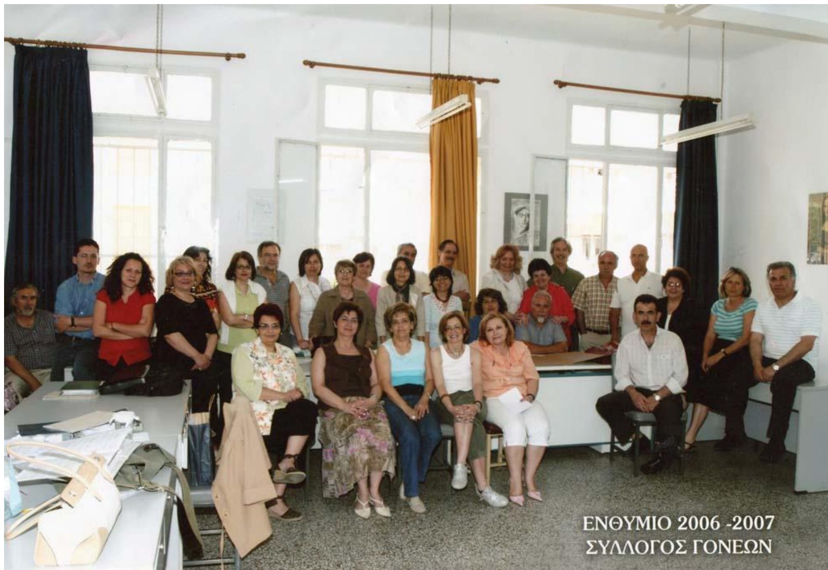
ΕΝΘΥΜΙΟ 2006 -2007 ΣΥΛΛΟΓΟΣ ΓΟΝΕΩΝ